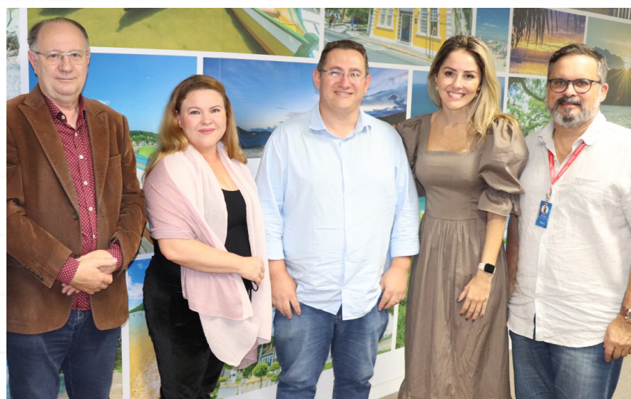
Registro das primeiras liberações em Palhoça