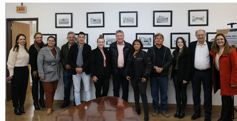
Comemoração do primeiro ano do Juro Zero São Bento do Sul