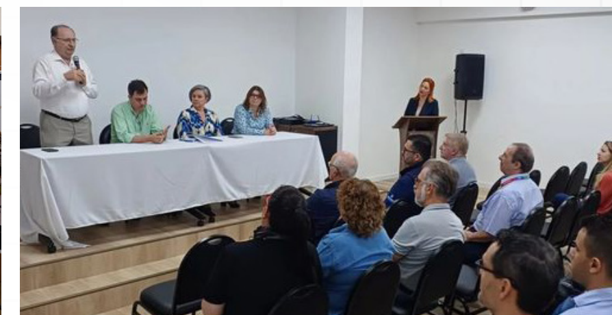
Nova etapa do Juro Zero Floripa